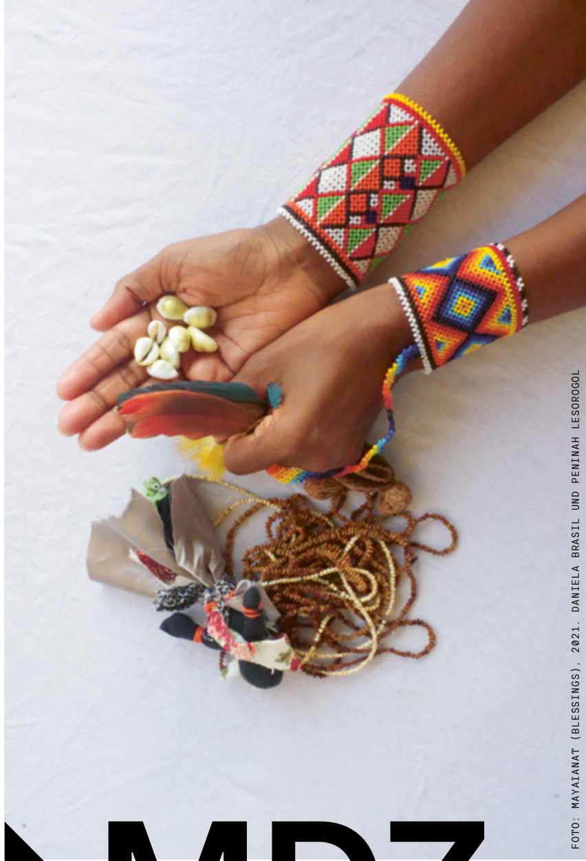
FOTO: MAYATANAT (BLESSINGS), 2021. DANIELA BRASIL UND PENINAH LESOROGOL